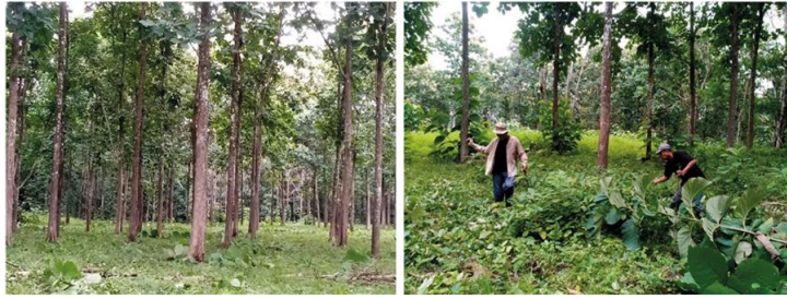
Underhåll och manuellt röjningsarbete