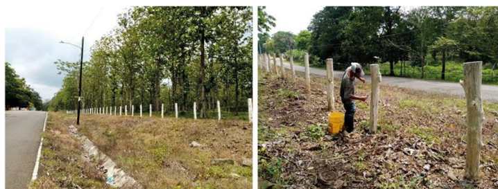
Reparation av staket